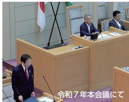
令和7年本会議にて

私この度5月26日の本会議において、神戸市会第119代副議長に就任いたしました。任期は1年間と限られた期間ではありますが、2元代表制の一翼を担う議会の責任と役割をしっかりと果たすべく、議長を補佐しながら、公正で円滑な議会運営に向けて努力して参る所存です。 神戸市は震災から30年の節目の年を迎えています。震災の経験と教訓をしっかりと活かしながら引き続き災害に強いまちづくりを目指すとともに、将来に亘って持続可能なまちづくりに向けて議会としてもしっかりと議論して参ります。