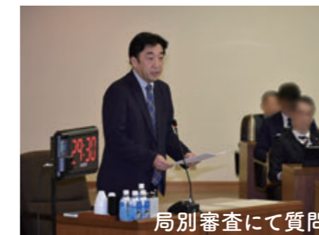
局別審査にて質問

これからの神戸の1年間の方向性を示す予算市会が行われました。私のこだわり政策の質疑と主要施策予算の状況を、施策と予算額をセットにてご報告させていただきます。