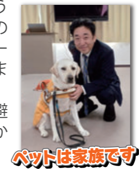
ペットは家族です