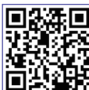
プロジェクションマッピング

昨年2月の予算特別委員会にて、「もっと動きのある魅力的な光の演出を工夫して、六甲アイランドの賑わい活性化につなげてはどうか」と提案。1年2か月を経て、神戸ファッションプラザの外壁にて投影が実現に。6月28日からは、新たに夏のコンテンツが投影中です。(詳細はQRコードにて)