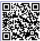
質疑の様子 (予算特別委員会)

引き続き、小さなお声もしっかりと聴かせていただき、課題解決に結びつくように、「初心忘れず」努めてまいります。