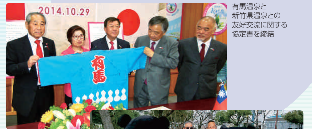
有馬温泉と新竹県温泉との友好交流に関する協定書を締結

神戸と台湾は華僑の方々を中心につながりを育んできており、議会もその努力を続けてきました。今後、観光はもちろんのこと、産業・文化・人的交流の面でも連携をさらに掘り下げ、強めていきたいと思っております。