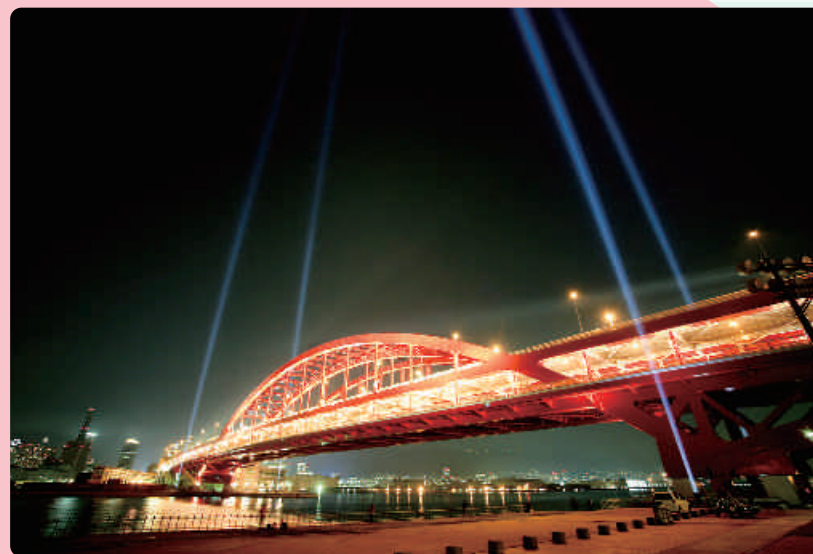
神戸大橋ライトアップ