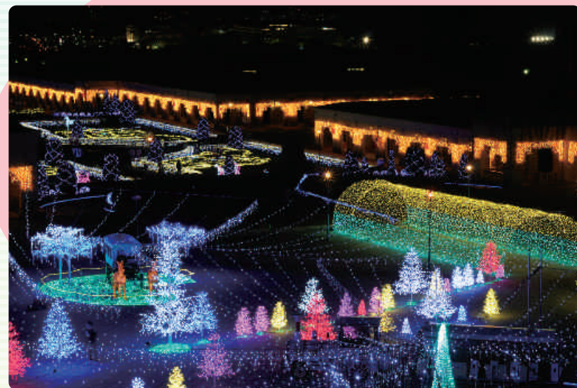
神戸イルミネージュ(フルーツフラワーパーク)

私たち議員団は、宿泊・滞在型の街に育てていくことを目的に、「光の都」神戸として、神戸の夜景や景観を更に魅力あるものにしていくことを提言してきました。現在、「神戸大橋のライトアップ」や「フラワーロード光のミュージアム」を始め、フルーツフラワーパークや水族園のライトアップなど、実現へと大きく前進することができました。これからも、「光の都」神戸の実現を目指して、更なる光の輪を広げていきたいと思っています。