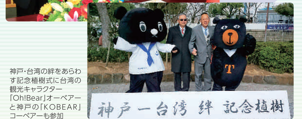
神戸・台湾の絆をあらわす記念植樹式に台湾の観光キャラクター「Oh!Bear」オーベアーと神戸の「KOBEAR」コーベアーも参加