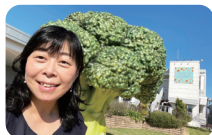
神戸空港の屋上展望デッキには巨大なプロッツリーが展示され、フオスポットとなっています!

神戸空港は大切な“神戸の財産” です!これからも神戸空港のさらなる利活用と、新たな神戸のまちづくりに力を入れて取り組みます!