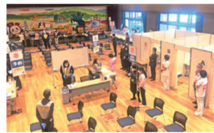
集団接種会場の様子

「報告すること」を主眼に活動してきました。議員報酬は皆様からの税金です。雇い主である市民の皆様へ神戸市や議会の状況を報告することが大事と考えています。市会ニュースの配布や街頭などで市政の報告を行っています。神戸市政が遠い存在にならないように努力しています。 新型コロナウイルス感染症対策に引き続き全力で取り組みます。医療崩壊を避けるべく、病床数の確保をはじめ医療提供体制の充実、3回目のワクチン接種のスピードアップなど早急に道筋を立てます。また疲弊した神戸市民の生活や経済を好転させるべく大胆に提案して参ります。