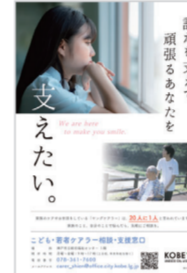
子ども・若者ケアラー相談・支援窓口のチラシ

昨年9月の本会議にて会派を代表し、インターネット上の差別的な発言から市民を守る取組みの拡充について質疑しました。その結果、翌月からは、毎月1回、実施日の直近1週間前までのインターネット上の書き込みを対象に、モニタリングが実施されるようになりました。 また、近年増加している「子ども・若者ケアラー」が、若くして家庭内のケアで燃え尽きてしまうことが決してないようにと、神戸市に強く要望しました。現在では、当事者のための居場所（交流情報交換の場）も設置されています。 「老若男女にやさしい神戸のまち」の実現に向けて、引き続き地道に努めて参ります。