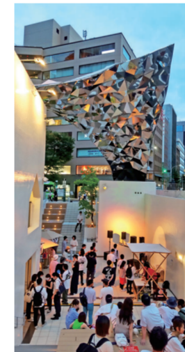
ナイトミュージックマーケット(三宮プラッツ)

今回の夜市は、不定期での開催となりましたが、今後は常設型の神戸夜市が開催されるよう取り組みを進め、コロナで落ち込んだ神戸経済を活性化させたいと考えています。