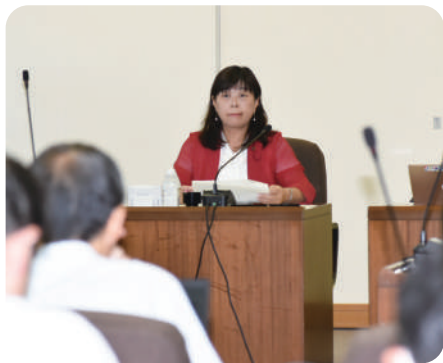
建設防災委員会の議事進行をしています!

おいしく安全な水道水の提供、公園や道路・下水道の整備、街灯や防犯カメラで地域の安全を守り、市民のみなさまの命を守る分野の常任委員会です。来年2025年には阪神淡路大震災から30年を迎えます。南海トラフ地震や様々な災害に備える力強いまちづくりを推進します!