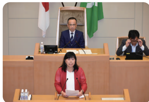
R6.5.29 市長に質問しました!