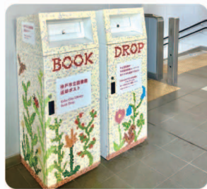
JR 灘駅構内の図書返却ポスト

要望 住吉駅から東灘図書館まで、さほど離れていないとのことだが、よちよち歩きのお子さんには、かなりの距離ではないか。また、雨の日の移動も大変なので、前向きに検討いただきたい。