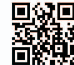
ファッションプラザ