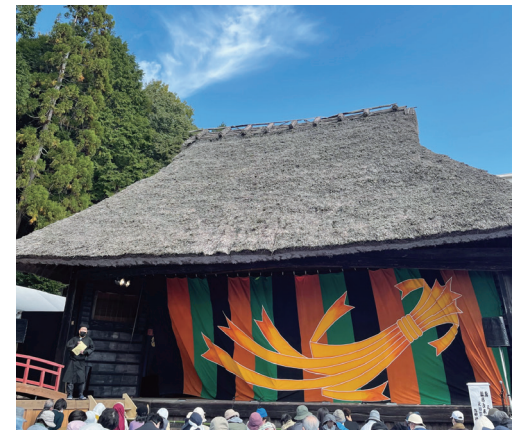
▶ 歌舞伎が上演されることで舞台がよみがえります! '22/10/30

北区には、山田町の下谷上農村歌舞伎舞台(右写真)、上谷上農村歌舞伎舞台、淡河町北僧尾など、国内でも有数の農村歌舞伎舞台が保存されています。この舞台で北区役所や地元の保存会のみなさんが、毎年秋に歌舞伎上演会を開催しています。この貴重な文化財をさらに有効活用して、国内外の方が訪れることが出来るよう情報発信していくことや、保存と共に観光のための活用をすすめるよう要望しました。