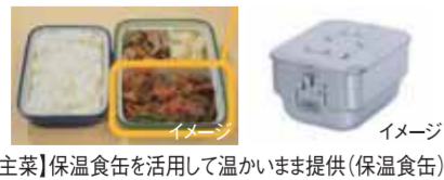
【メインの主食】保温食缶を活用して温かいまま提供(保温食缶) イメージ