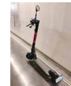
電動キックボード

ひきつづき、暮らしやすい利便性の高い北区のまちづくりに取り組んでいくとともに、国際金融センターの誘致など、さらに高みの都市を目指します。