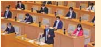
コロナ対策下での質疑風景(R2.4.30)

令和2年度の神戸市会では2回にわたる緊急事態宣言の中、緊急議会が開催されたほか、神戸市民の命と暮らしを守るため4回の補正予算審議が行われました。私たち議員団からは、神戸市への要望を取りまとめ、提言した上で質疑いたしました。