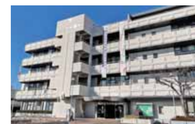
生まれかわる玉津庁舎（現・西区役所）

昨年の本会議一般質問において「玉津庁舎の利活用」について質問し、地域の拠点として機能を高め、より魅力ある庁舎としてリノベーションして頂きたいと訴えました。新たな玉津庁舎は、子育て世帯や若者が今まで以上に気軽に訪れることができ、そして親子での交流や若者の学びの場として有効に活用できる“居場所”としての機能も追加し整備されていく予定です。