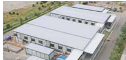
中央市民病院臨時棟

益々冷え込む神戸経済や雇用不安も予想されます。支援策について、国や県と直接交渉することも益々必要となります。神戸独自の支援策メニューも早急に出さねばと考えます。