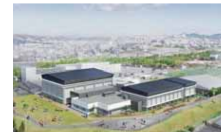
新垂水体育館イメージ図

また、垂水駅周辺は垂水図書館の移転・新築や子育て支援拠点の整備、中核的医療施設が誘致されるなど大きく変わろうとしています。