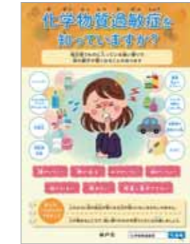
化学物質過敏症の子供向けポスター

「コロナウイルスが不安で市バスに乗れない」と、利用者からのお声が届きました。抗ウイルス・抗菌加工を先行実施していた京都市の事例をもとに、昨年9月議会にて神戸市でも早期導入するように訴えました。その結果、3月末までに、全車両【地下鉄238両(43編成)、市バス515両】への加工が進んでいます。