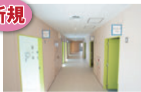
こども家庭センター (カウンセリングルーム)