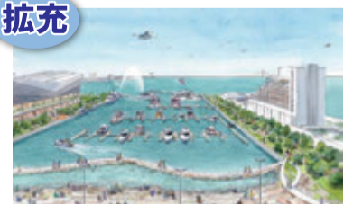
新港第1・第2突堤間水域活用