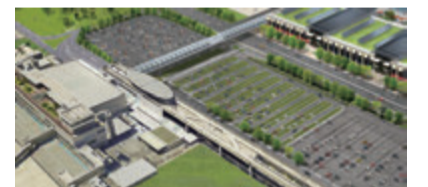
歩行者デッキ整備イメージ