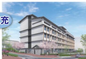
こうべ小学校の校舎整備イメージ