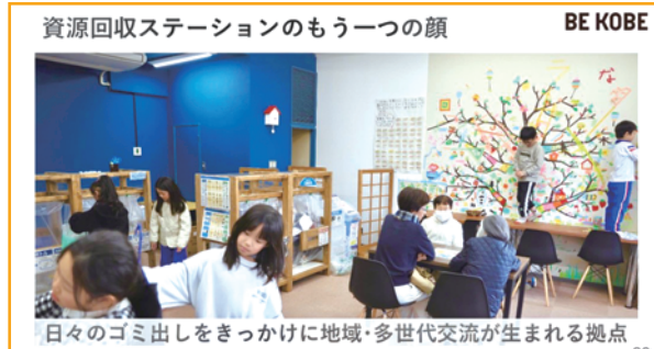
資源回収ステーションのもう一つの顔

利用者からは、「ごみ出しが楽しくなった」「いつでもだせて便利、容器包装プラスチックの指定袋を買わなくていい」「一人暮らしなので人のいるところへ行くと楽しくなる」「外出する機会が増えた」という声が届いています。