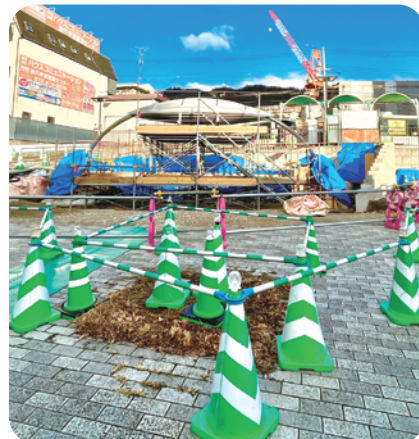
1月4日の現地の様子