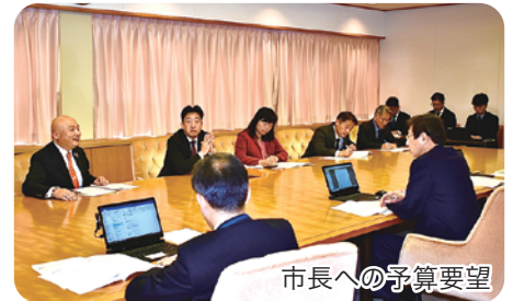
市長への予算要望

※スクールサポートスタッフ…教職員が児童生徒への指導や教材研究等に注力できるように、学習プリントなどの印刷や実技教科の教材準備を行う。