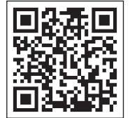
資源回収ステーション詳細