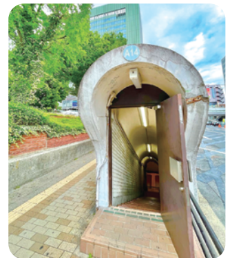
ガリバートンネル