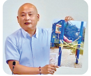
委員会で現状を指摘