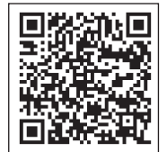
甲南山手駅前リニューアル