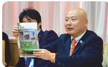
車両の現状を説明