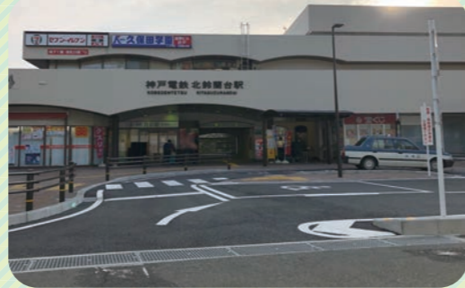
駅前スペースを活用して、車で利用しやすくなりました。

北鈴蘭台駅には通勤や通学時はもとより、塾の送迎などにたくさんの車が来ていますが、このほど、車の回転地が完成し、今までよりスムーズに自家用車が回れるようになりました。今後は、市営桜ノ宮住宅の建て替えや、新築戸建の建設が進むなど、北鈴蘭台駅周辺も変化していきます。これからも利用しやすい駅前空間の整備を求めています。