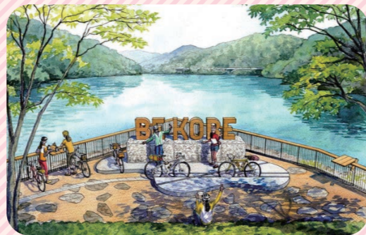
山田町のつくはら湖 眺望がすばらしいサイクリングロードへぜひお越しください。

それに向けて、つくはら湖周辺のトイレ整備やレンタサイクル等、山田地域の活性化を求めています。