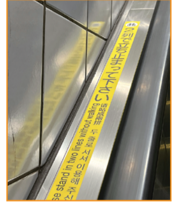
② 注意喚起ステッカー