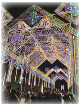
今年のルミナリエの様子

質問 今年度の神戸ルミナリエは、閑散期となる1月の神戸の夜のまちの経済活性化に寄与したと考えるが、引き続き1月開催で進めるべきではないか。