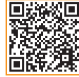
① 地域コミュニティ交通