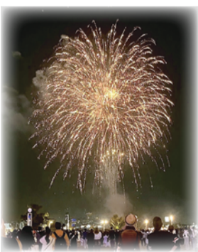
メリケンパークの花火

再質問 花火をはじめとした夜型観光コンテンツを、来街者を魅了できるよう、当該エリアで年間を通じた夜間景観の形成によりいっそう取り組むべきでは。