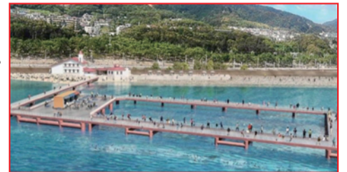
⑦ 須磨海釣り公園イメージ