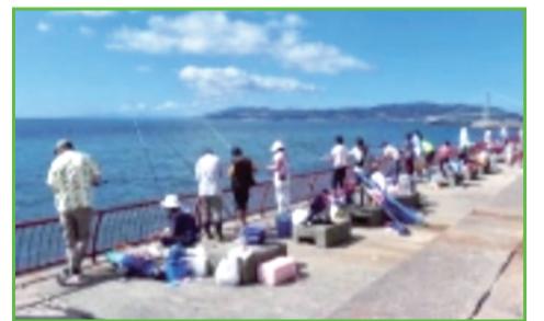
⑮-① 海釣り広場イメージ (神戸市立平磯海づり公園)