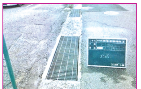
㉔ 溝蓋の異音防止改修