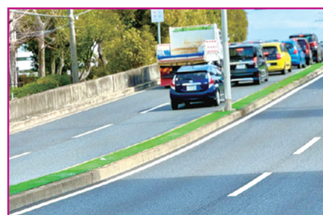
㉓ 道路中央の雑草防止対策