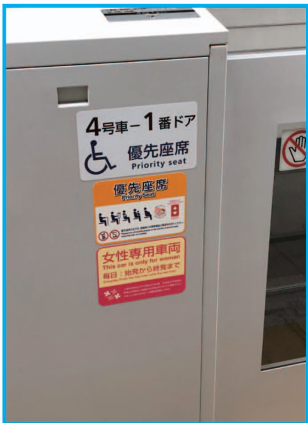
⑬ 三宮駅のホームドア