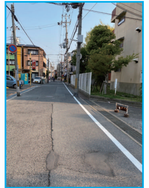
⑳ 県道345号線の新しい路側帯