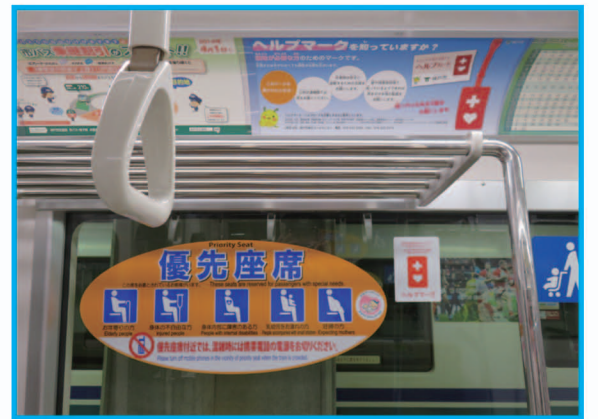
⑩ 優先座席でのお知らせ