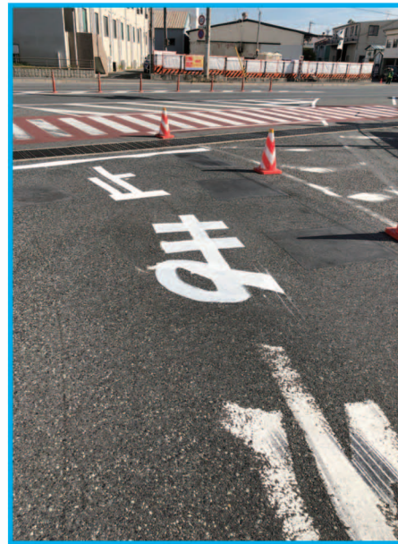
⑲ 魚崎浜インター出口の緊急補修工事