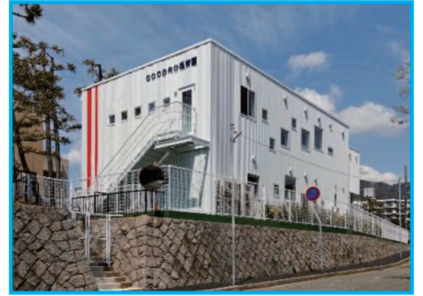
② 石屋川公園内の新設保育園