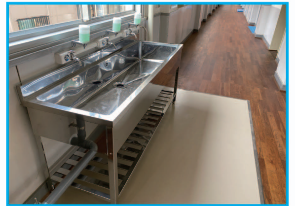
⑦ 原田中学校の手洗い場